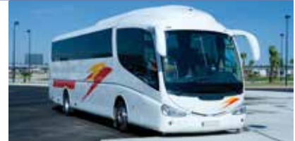
Perfiles para la construcción